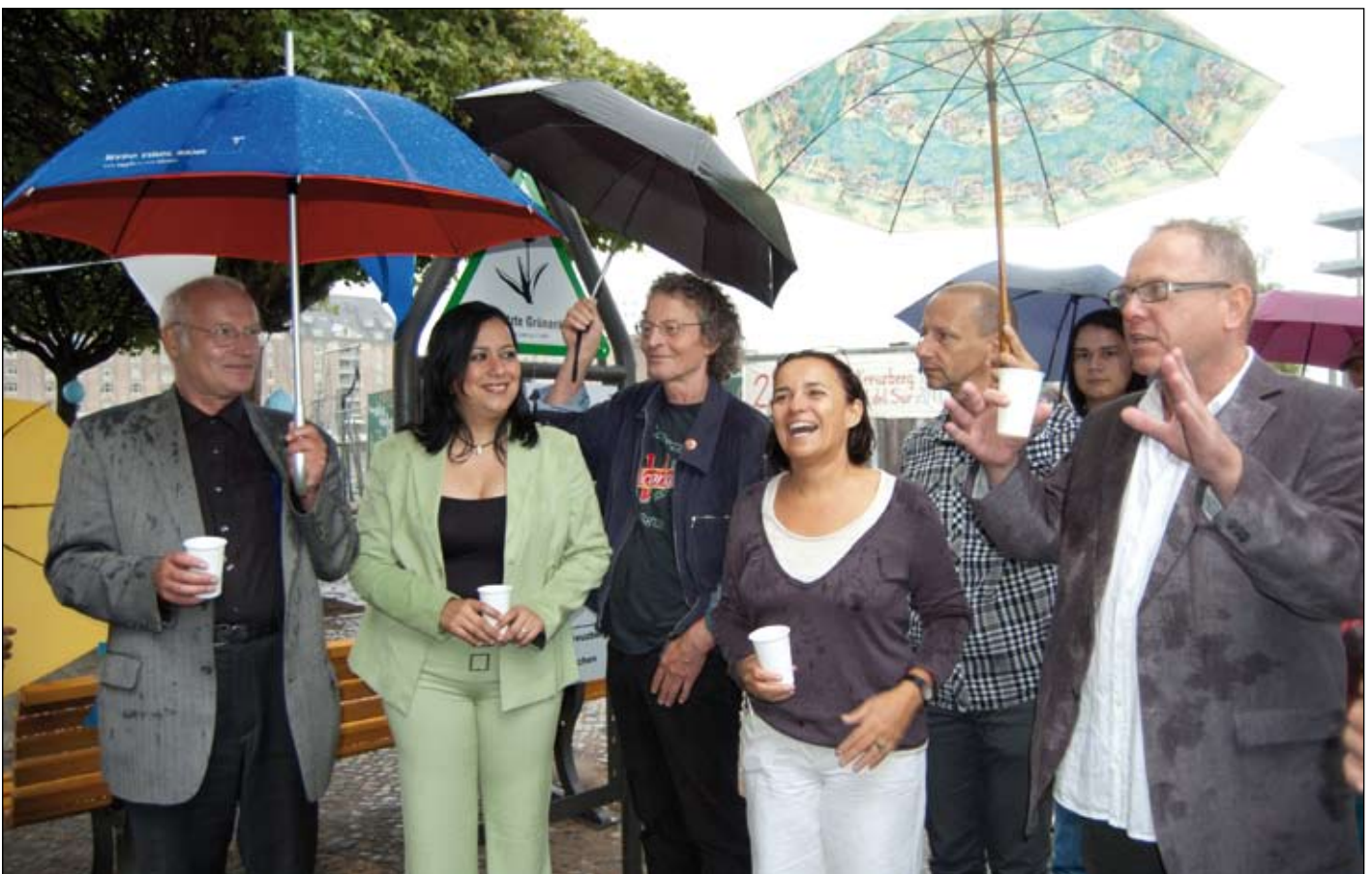
Nass, aber glücklich bei der Einweihung der Plaza San Rafael del Sur

Einwöchiger Delegationsbesuch aus San Rafael del Sur in Friedrichshain-Kreuzberg