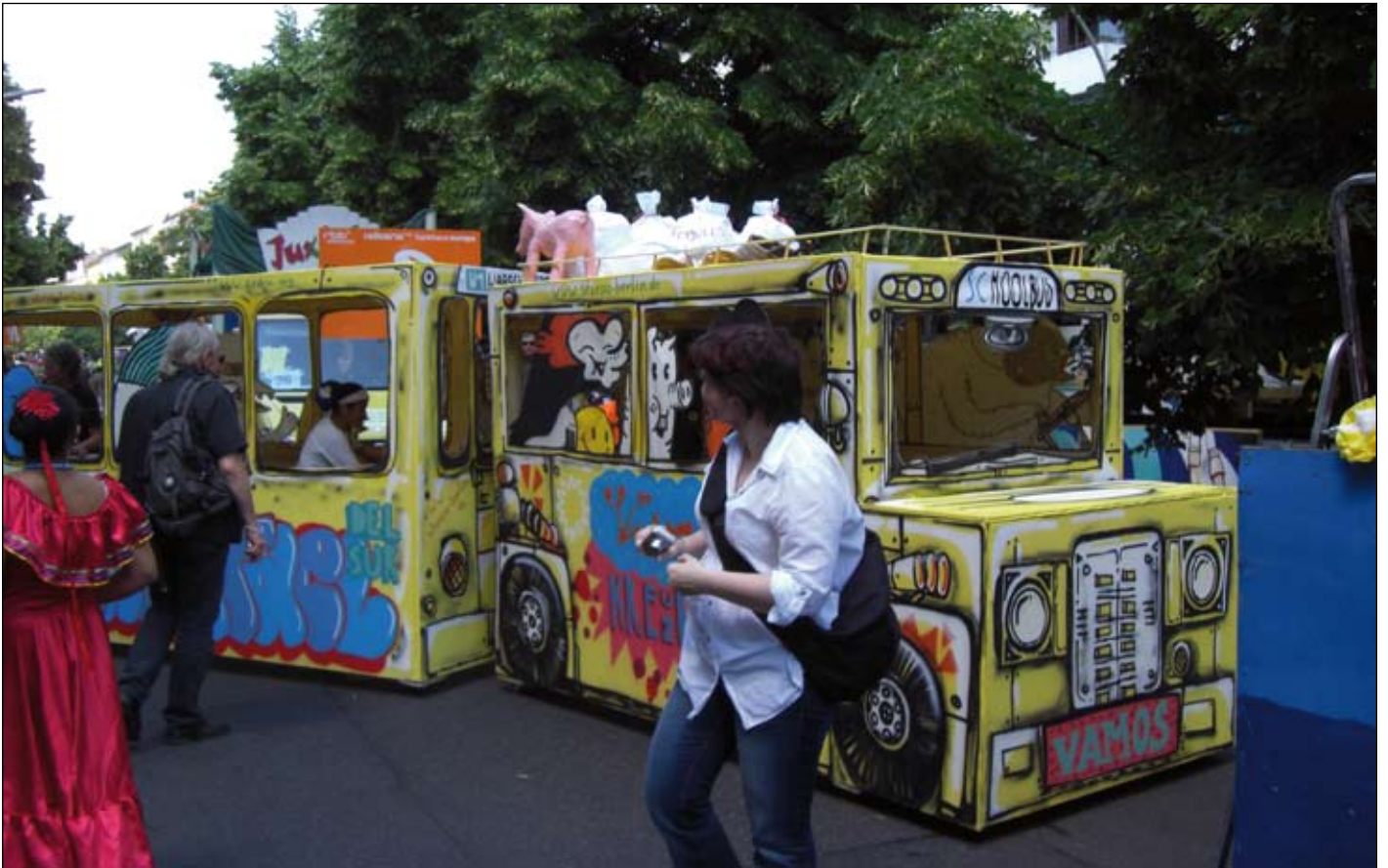
Mit Bus und Bahn beim Karneval

Nach der „Abstinenz“ vom Karneval der Kulturen im vergangenen Jahr hatten wir von der StäPa uns für das Jubiläumsjahr 2011 viel vorgenommen – und wir haben