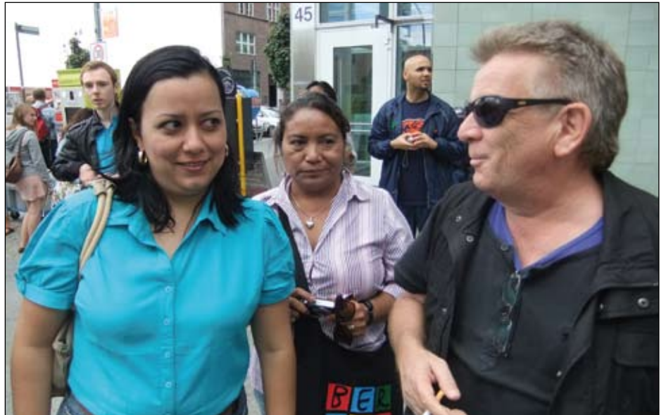
Sightseeing: Da darf der Checkpoint Charlie nicht fehlen