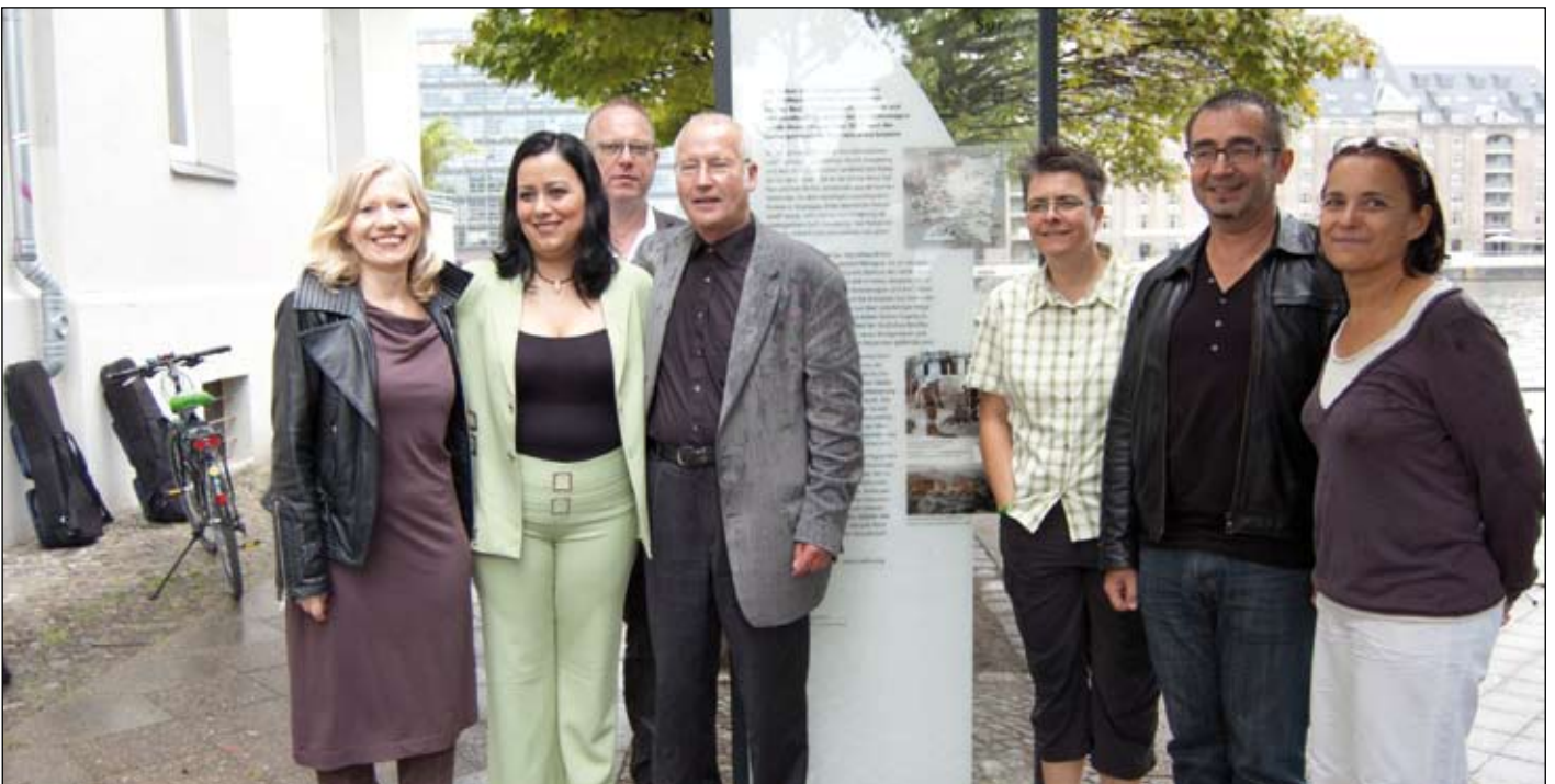
Der große Moment: Nun heißt der Platz ganz offiziell „Plaza San Rafael del Sur“!