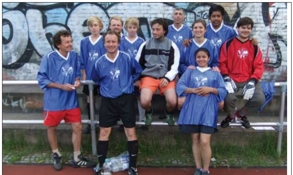
Unser Team 2011

Da eine gemeldete Mannschaft nicht antreten konnte, wurden aus den 11 verbliebenen Teams für deren Spiele jeweils zusammengewürfelte „All-Star-Teams“ gebildet, die später allerdings den letzten Platz belegten. Erfreulich und anerkennenswert war, dass der FC Dragon mit einer