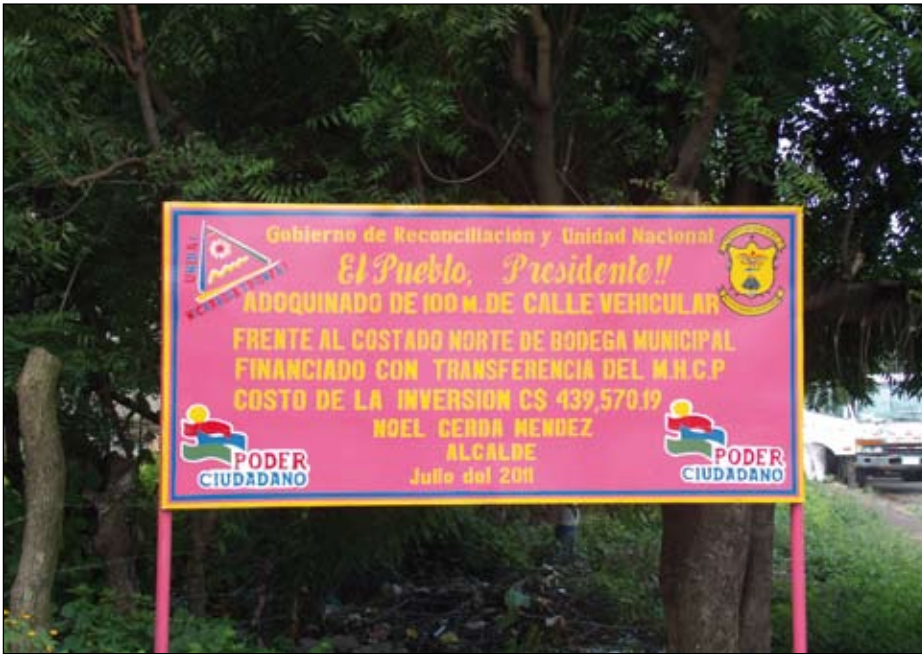
Wer hat diesen Straßenbau von 100 m Länge entschieden?

tern mit behinderten Kindern) und der Asociación Intergeneracional por la Paz y la Vida (Intergenerationenverein für den Frieden und das Leben) durchgeführt. In diesen Workshops erhielten die NGOs intensive Schulungen zu grundlegenden Beteiligungsrechten im Rahmen der Kommunalpolitik und zur strategischen und finanziellen Planung von Projekten und Kampagnen für benachteiligte Gruppen im Municipio San Rafael. Viele dieser Projekte und Kampagnen wurden seither schon mit eingeworbenen Projektmitteln, aber auch durch Spenden lokaler Gewerbetreibender und Firmen verwirklicht.